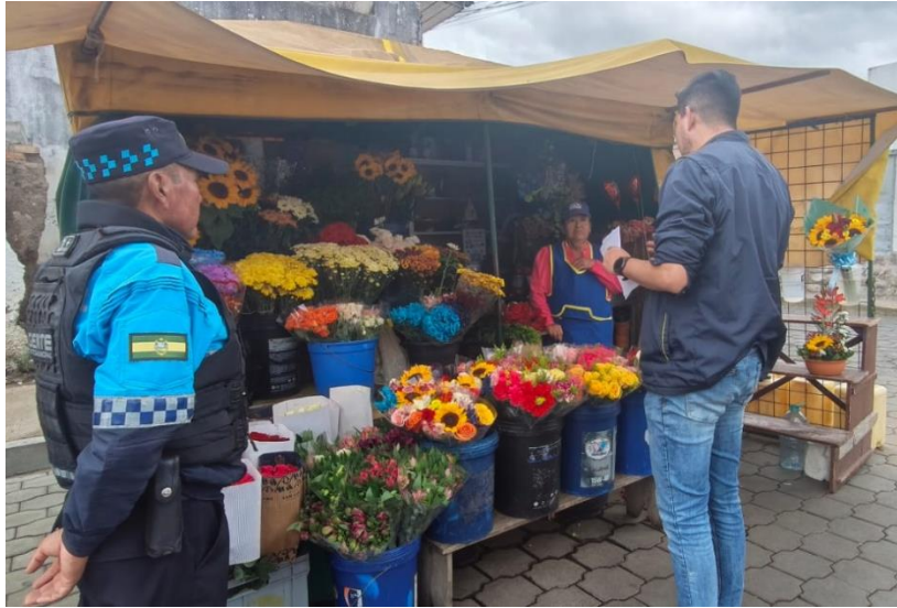
Fotografía 2. Actividades de control y concienciación ambiental dirigidas a comerciantes del sector del cementerio para la mitigación de problemas socioambientales.