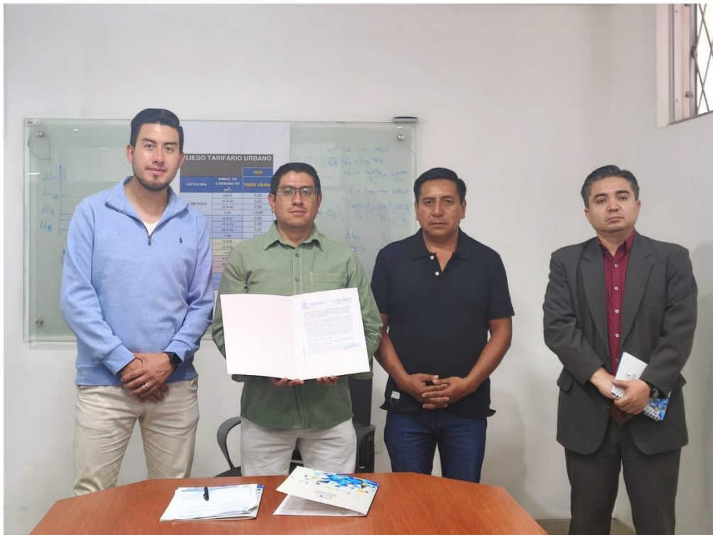
Fotografía 3. Evidencia de firma de convenio con EMAPAAC-EP y PROVIDA W&M

La articulación estratégica entre la EMAPAAC-EP y PROVIDA W&M representa un avance significativo en la consolidación de un sistema local de gestión ambiental responsable, permitiendo fortalecer las acciones de control, regularización y educación ambiental dirigidas a los sectores productivos del cantón. En este sentido, el convenio se constituye en un instrumento clave para la protección de los recursos naturales, la prevención de impactos ambientales negativos y el mejoramiento de la calidad ambiental del territorio, beneficiando directamente a la población y contribuyendo al cumplimiento de los objetivos de desarrollo sostenible y la normativa ambiental aplicable (ver fotografía 3).