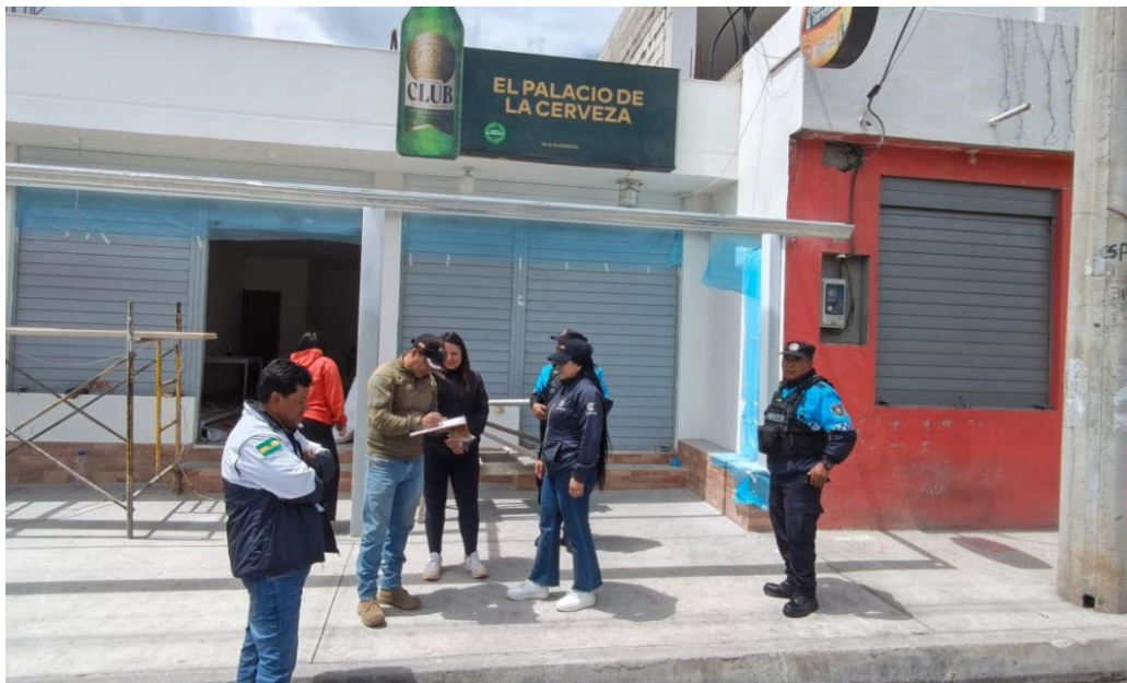
Fotografías 1. Evidencias de ejecución de operativos de control de tachos de residuos sólidos en locales comerciales – inmediaciones parque la Remonta.

De igual manera, se emitieron recomendaciones técnicas orientadas al fortalecimiento de las prácticas de manejo integral de residuos sólidos, promoviendo la corresponsabilidad de los actores involucrados y la adopción de medidas preventivas que contribuyan a reducir los focos de contaminación identificados en el sector. Estas acciones permitieron reforzar la presencia institucional y generar conciencia sobre la importancia de conservar los espacios públicos en condiciones adecuadas para el uso y disfrute de la ciudadanía (ver fotografías 1).