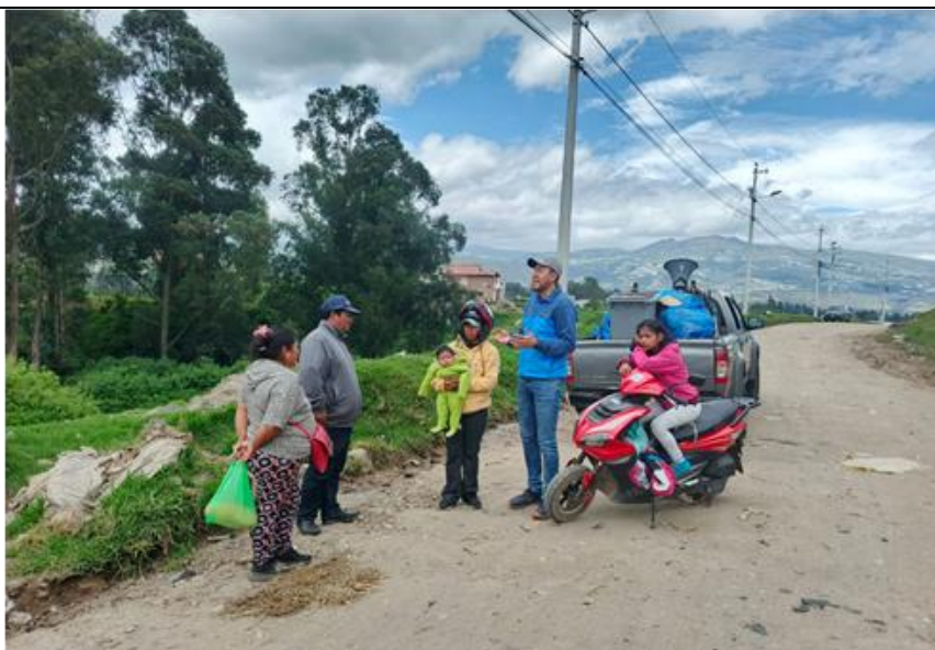
Fotografía 1.- Atenci3n de denuncia en el sector del Pogyo para mitigar problemas socio ambientales por incorrecta disposici3n de residuos s3lidos y presencia de fauna urbana.

En este contexto, la atención eficiente y oportuna de denuncias ciudadanas se convierte en un mecanismo esencial para identificar prácticas inadecuadas y promover acciones correctivas, reforzando así los sistemas de manejo sostenible de residuos. Además, la participación activa de la sociedad en la vigilancia fomenta una gobernanza inclusiva y transparente, donde ciudadanos, empresas y autoridades colaboran en la construcción de una ciudad de Cayambe más limpia. Por ello, se han establecido procesos ágiles y menos burocráticos para la recepción, investigación y resolución de denuncias relacionadas con la disposición inapropiada de residuos es clave para lograr una gestión responsable de los recursos y minimizar los impactos a largo plazo (ver fotografía 1).