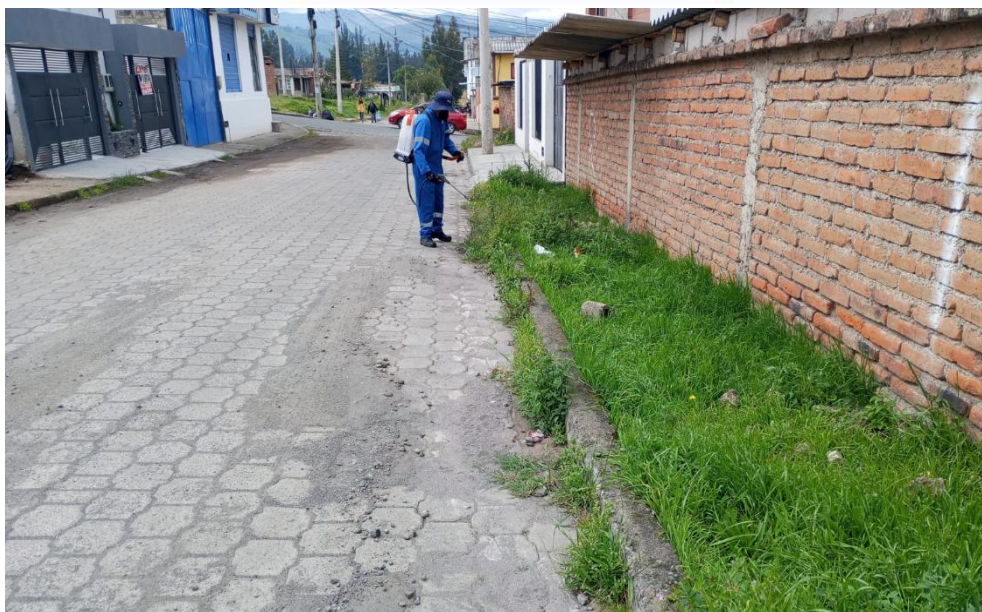
Fotografía 5. Aplicación de glifosato para control de malezas.