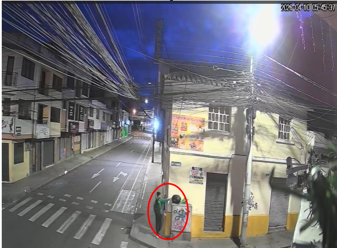
Imagen 1. Identificación de infracción en la calle Ascázubi y Vargas mediante sistemas de video vigilancia.