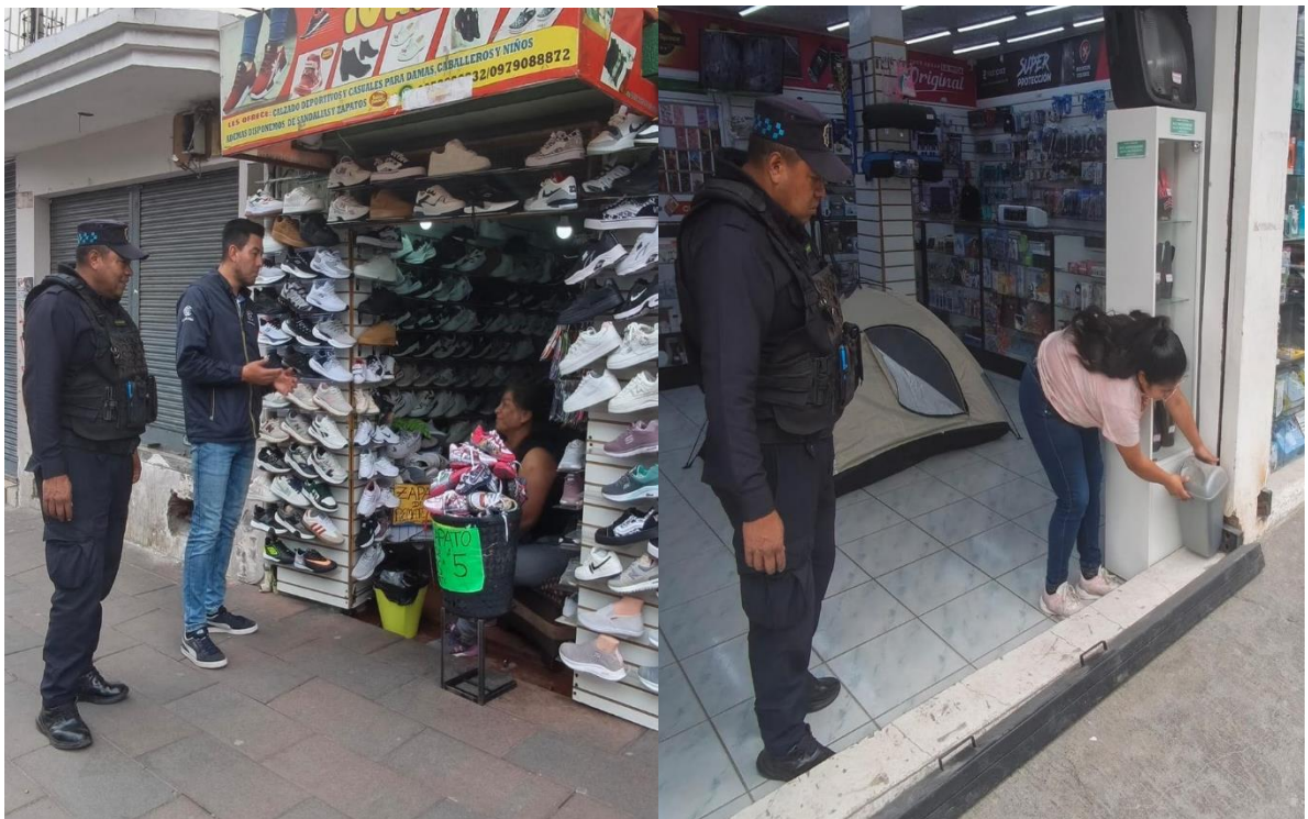
Fotografías 1 y 2. Evidencias de ejecución de operativos de control de tachos de residuos sólidos en locales comerciales.

Durante las jornadas de intervención se realizaron recorridos preventivos, inspecciones visuales y actividades de socialización dirigidas a propietarios y administradores de establecimientos comerciales, mediante las cuales se informó sobre las obligaciones establecidas en la normativa municipal, las prohibiciones relacionadas con la contaminación visual y disposición inadecuada de residuos, así como las posibles sanciones derivadas de su incumplimiento. De igual manera, se brindaron recomendaciones técnicas orientadas a mejorar las prácticas de manejo de residuos sólidos y mantener las áreas exteriores de los locales en condiciones adecuadas de limpieza (ver fotografías 1 y 2).