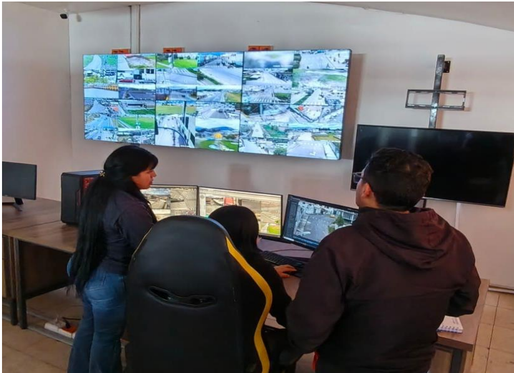
Fotografía 3. Revisión de cámaras de video vigilancia de la Dirección de Seguridad ciudadana para identificación infracciones ordenanza GIRS.

En el marco de esta coordinación técnica, se efectuó la identificación de presuntos infractores que realizaban el abandono de residuos sólidos fuera de los horarios y sitios autorizados, información que permitió sustentar procesos administrativos sancionatorios conforme a la Ordenanza para la Gestión Integral de Residuos Sólidos vigente. Asimismo, se establecieron mecanismos de interoperabilidad y acceso coordinado a la sala de video vigilancia, optimizando el seguimiento de puntos críticos y fortaleciendo las acciones de control ambiental y limpieza urbana (ver fotografía 3).