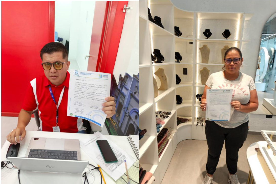
Fotografías 3 y 4. Entrega de notificaciones informativas para regulación de entrega de publicación volante.

De manera particular, y en atención a la reciente inauguración del centro comercial Altos del Cayambe Shopping, se procedió a realizar recorridos de inspección y socialización en los diferentes locales que conforman este espacio comercial. Esta intervención tuvo como finalidad poner en conocimiento de los administradores y propietarios de los establecimientos las disposiciones establecidas en la Ordenanza para la Gestión Integral de Residuos Sólidos (GIRS).