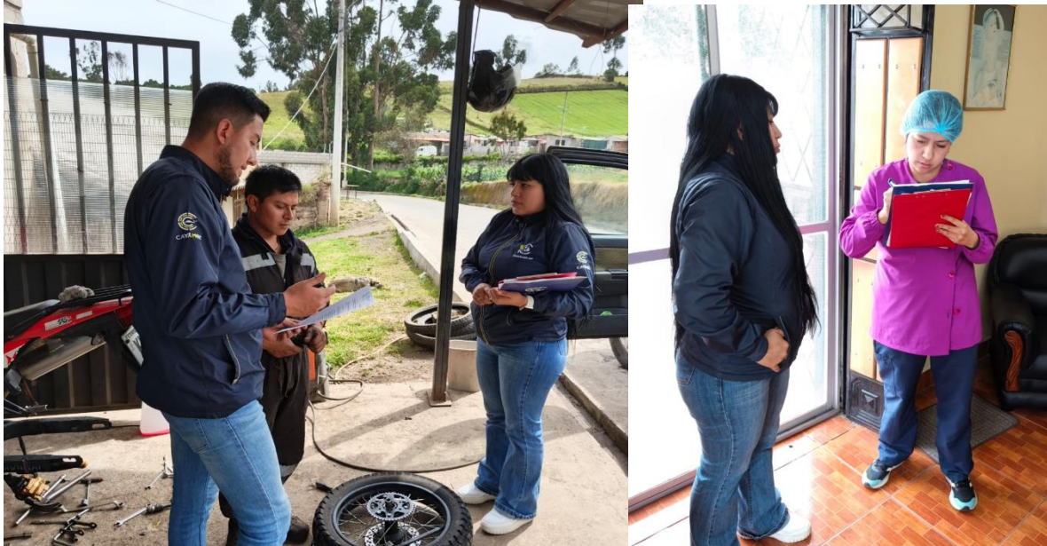
Cuadro 2. Cuantificación de notificaciones entregadas por parroquia.

Fotografías 1 y 2. Entrega de notificaciones informativas sobre adecuado manejo a generadores de desechos peligrosos.