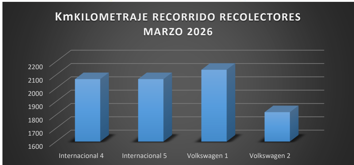
Gráfico 1. Comparativo de kilometraje de la flota vehicular de recolección del mes de marzo 2026.

Del cuadro 2 y gráfico 1, se observa para el mes de marzo 2026, el vehículo Volkswagen 01 presenta el mayor valor de recorrido, en cuanto que el vehículo Volkswagen 02 presenta el menor recorrido, muy por debajo de los valores normales, que seguramente se deba a un error en el tablero de marcación del kilometraje.