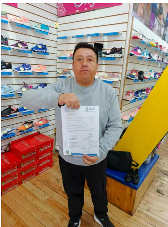
Fotografías 1 2 y 3. Entrega de notificaciones para colocación de tachos de basura y regulación en la entrega de publicidad volante.