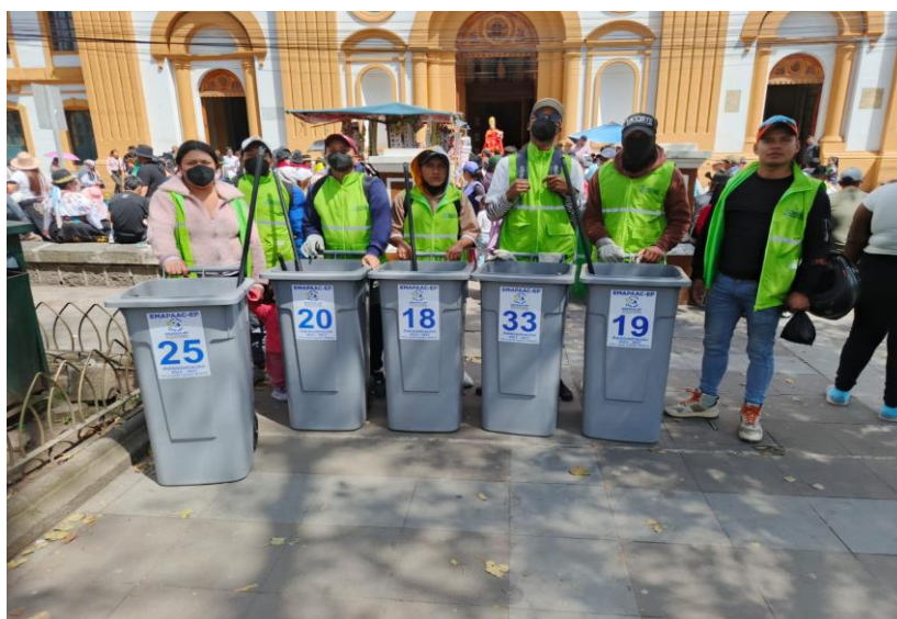
Fotografías 4,5 y 6. Actividades de supervisión y control realizadas por la Jefatura de Control de la Contaminación en julio como parte de las fiestas de Cayambe.