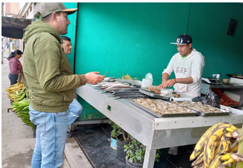
Fotografía 3. Atención a denuncia en campo para generar medidas correctivas por incorrecta disposición de residuos por parte de pescadería del barrio el Sigal.

Se considera denuncias informales, aquellas que son receptadas a través de medios de comunicación digital como son Facebook y Whatsapp o vía telefónica mismas que son receptadas en las oficinas de la EMAPAAC-EP, a través del número telefónico 2 110-611 Ext 111. Se debe mencionar que las denuncias informales carecen de información específica del denunciante y en la mayoría de las mismas no se proporcionan nombre número de cédula y no se tiene firma del respaldo de la denuncia. La mayoría de denuncias son relacionadas al mal servicio de recolección de residuos sólidos, falta de barrido manual en sectores específicos de la ciudad, abandono de residuos fuera del horario, no clasificación de residuos, presencia de predios descuidados, etc.