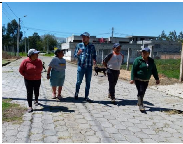
Fotografía 2. Entrega de notificaciones para la limpieza de los frentes de cada propiedad en el barrio Miraflores Bajo.