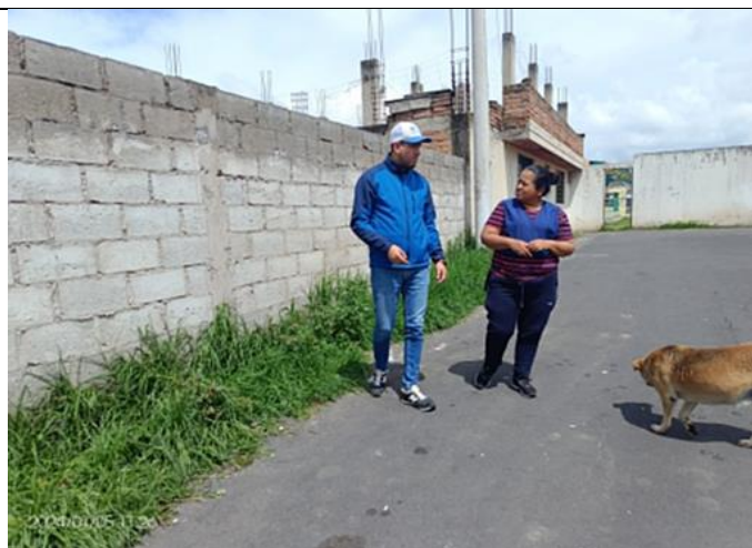
Fotografía 1. Entrega de notificaciones para la limpieza de los frentes de cada propiedad en el barrio Florida I.