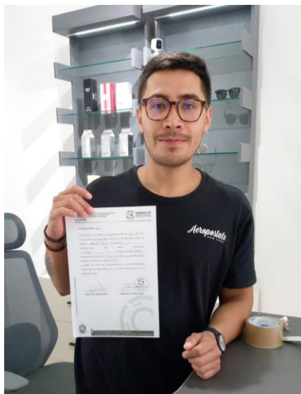
Fotografía 8. Evidencia de entrega de notificación para evitar emisión de publicidad volante.

Para lo cual, se han entregado notificaciones informativas a los principales locales comerciales de la ciudad con el objetivo de que disminuya la emisión de material publicitario y saquen el permiso correspondiente en caso de su emisión (ver fotografía 8 y cuadro 6).