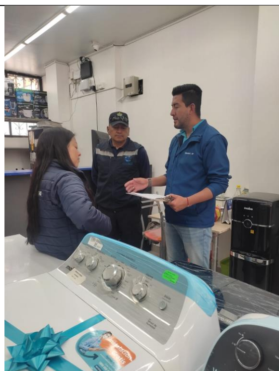
Fotografía 1. • Entrega de exhortos a locales comerciales en cumplimiento al Art. 78 literal C-6 en compañía de Agentes de Control Municipal.