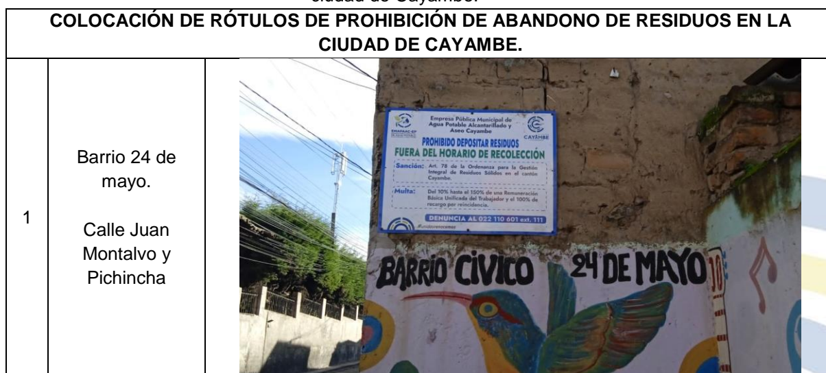
Cuadro 5. Detalle de la colocación de rótulos de prohibición de abandono de residuos en la ciudad de Cayambe.

A continuación se detallan y evidencian los lugares donde se ha intervenido en el transcurso del mes de abril. (ver cuadro 5).