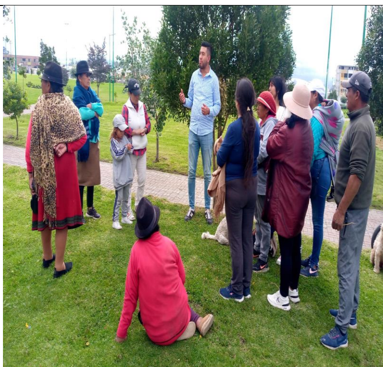
Fotografía 2. Entrega de exhortos a comerciantes de la asociación La Libertad y locales comerciales del parque La Remonta.