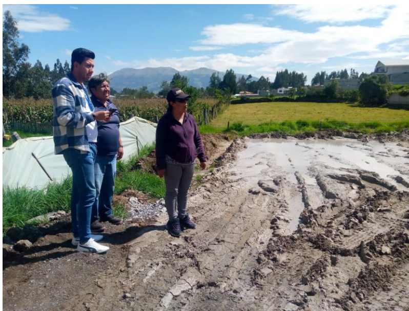
Fotografía 3. Atención a denuncia ciudadana sector de bodegas de Nestlé, relacionadas a la contaminación ocasionada por una hormigonera.

El total de las denuncias han sido atendidas de manera satisfactoria siendo necesaria en la mayoría de los casos una intervención informativa y en tres casos específicos fueron motivo de la aplicación de una sanción pecuniaria al contarse evidencias explícitas del cometimiento de infracciones a la ordenanza para la gestión integral de residuos sólidos. (ver fotografía 3).