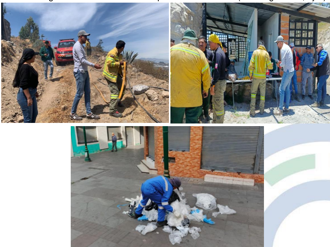
Fotografías 5,6 y 7. Actividades de supervisión, saneamiento, limpieza y control de las principales zonas de la ciudad y apoyo en el incendio de Otón.

Además, el sábado 14 de septiembre se realizó la supervisión del personal de recolección verificación de cumplimiento de rutas y se procedió a ejecutar el saneamiento de la zona céntrica comercial de la ciudad y puntos específicos donde de manera frecuente se visualiza el abandono de escombros y residuos sólidos. Paralelamente se prestó apoyo en el incendio acontecido en la comunidad de Otoncito, donde se encontraban el equipo de bomberos del Municipio de Cayambe y a quienes se dotó de agua con la instalación de un punto de hidratación (ver fotografías 5,6 y 7).