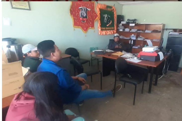
Fotografías 8 y 9. Charlas de capacitación con presidentes comunitarios de Olmedo.

En este contexto se culminaron las capacitaciones y socializaciones de las tasas GIRS con los dirigentes y comuneros del GAD parroquial de Olmedo, de esta manera queda en debate para definición de la aplicación de las tasas, en base a las recomendaciones otorgadas por los dirigentes, quienes propusieron se apliquen las tasas de manera progresiva con un incremento del 25% anualmente.