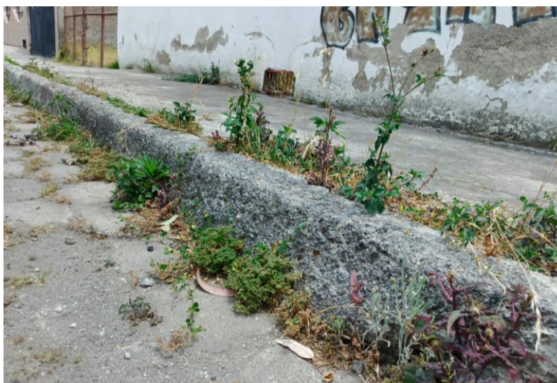
Fotografía 4. Ejecución de inspección control de limpieza de predios barrio Las Orquídeas.

Además, en referencia al Oficio Nro. EMAPAAC-EP-GG-2024-0281-O de fecha 23 de julio de 2024 y el Oficio Nro. EMAPAAC EP-GG-2024-0287-O de fecha 26 de julio de 2024 mediante el cual se solicita la participación de los propietarios de predios en el proceso de limpieza y embellecimiento de los barrios El Siglas y las Orquídeas, para lo cual se otorgará un plazo máximo de 15 días a partir de la fecha de realizada la solicitud, el cual por solicitud de los representantes barriales se extendió un mes, a razón de que más moradores de los barrios ejecuten la limpieza de sus frentes. Una vez vencido el plazo otorgado para la realización de la limpieza de predios, el martes 03 de septiembre del presente, se realizó la inspección a cada uno de los predios del barrio en compañía de las representantes barriales, el Sr. Edwin Almeida y el Ing. Santiago Villagómez en calidad de Jefe de Control de la Contaminación. (Ver fotografía 4).