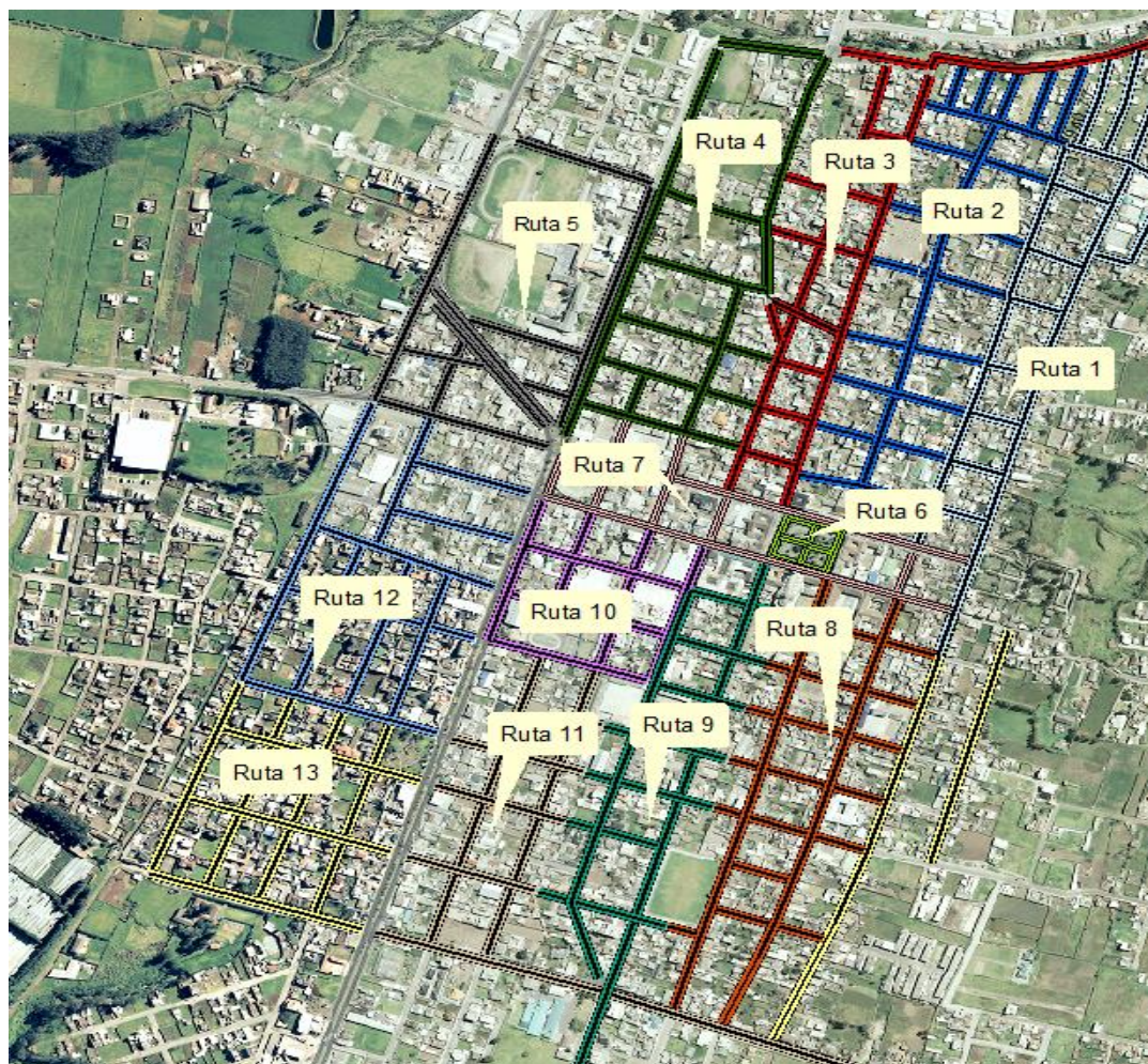
Imagen 1. Rediseño de las rutas de barrido manual de la ciudad de Cayambe.