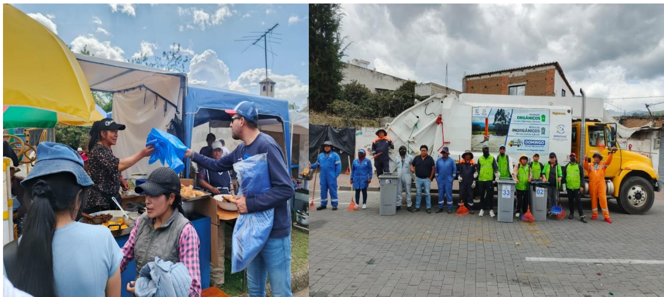
Fotografías 8 y 9. Actividades de supervisión de limpieza de eventos por fiestas de Cayambe 2024.

Es importante mencionar que se ha ejecutado actividades y supervisión de la limpieza antes durante y después de cada evento, con el objetivo de mantener integro el aseo de los espacios públicos en los cuales se han desarrollado los distintos eventos (Ver Fotografías 8 y 9).