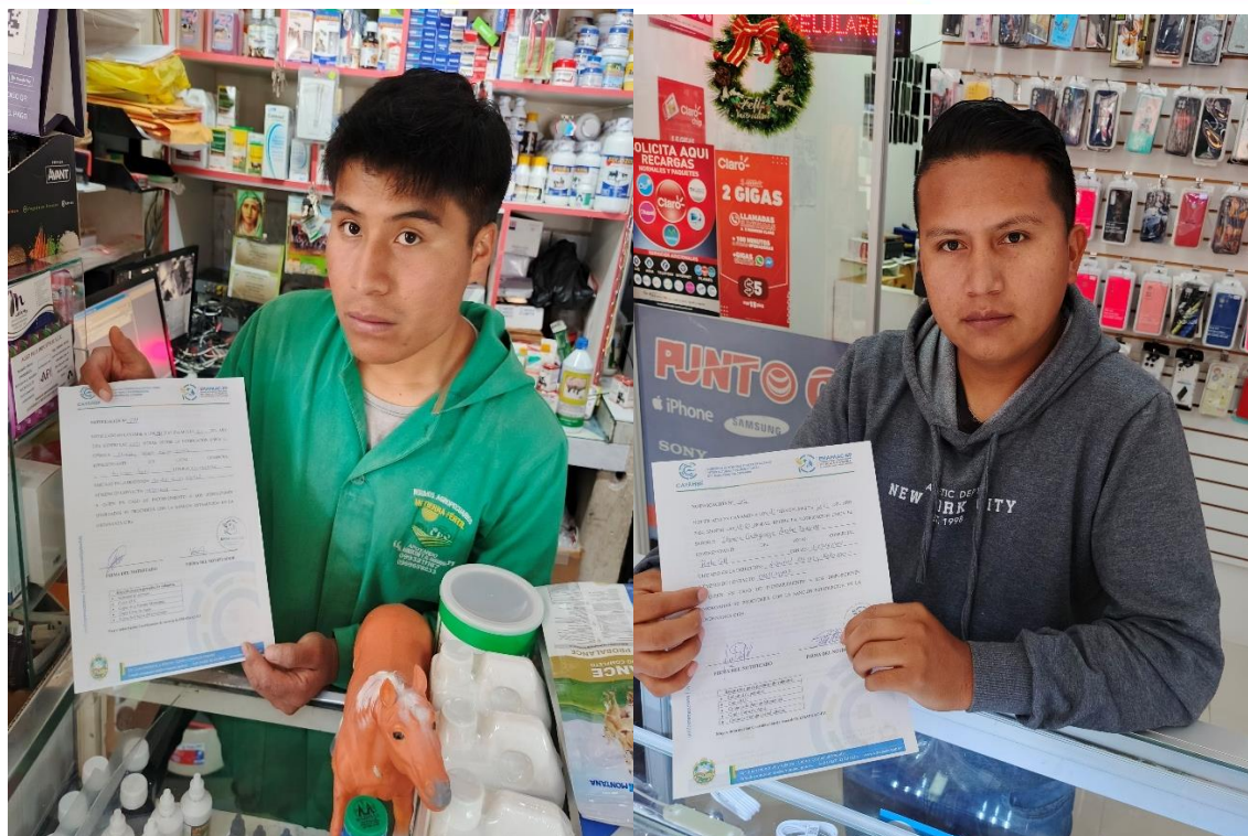
Fotografías 1 2,3 y 4. Entrega de notificaciones para colocación de tachos de basura y entrega de publicidad volante.