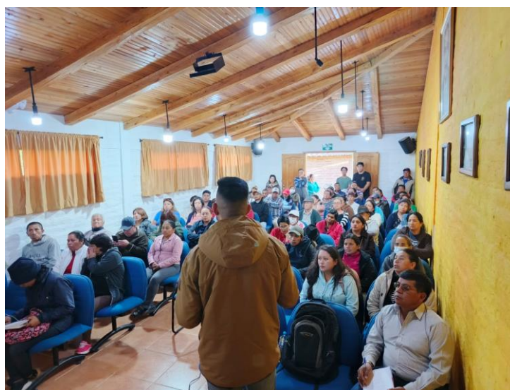
Fotografía 5. Capacitación Cayambe Basura Cero – Barrio Segundo Duran y Comunidad Santo Domingo 1.