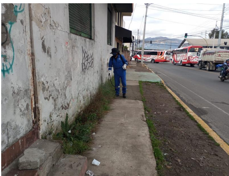
Fotografía 6. Aplicación de Glifosato en los barrios céntricos de la ciudad.

De manera complementaria una vez realizadas las entregas de notificaciones, ejecución de operativos de control y trabajo conjunto con dirigentes barriales por parte de la EMAPAAC-EP se realiza la aplicación de glifosato en concentraciones controladas (no nocivas). Para un manejo efectivo de malezas se deben utilizar un adecuado método de control, para ello, es muy importante reconocer las especies de malezas presentes para determinar el tratamiento más adecuado y así obtener un mejor control. Existen dos principales tipos de especies de plantas que se desarrollan en la zona urbana de Cayambe como son: el kikuyo y el taraxaco (diente de león), mismos que son cultivos perennes, razón por lo cual es preciso realizar la aplicación de un herbicida químico para evitar el desarrollo de estas especies y con ello precautelar el ornato y limpieza de la ciudad.