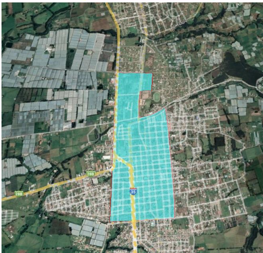
Imagen 1. Área de aplicación de herbicida en barrios céntricos de la ciudad ejecutados en el mes de junio.