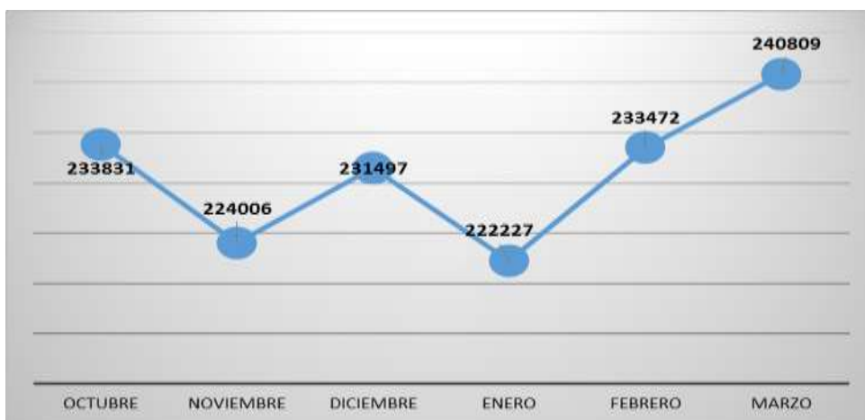
Gráfico 2. m 3 facturados Octubre – Marzo 2024