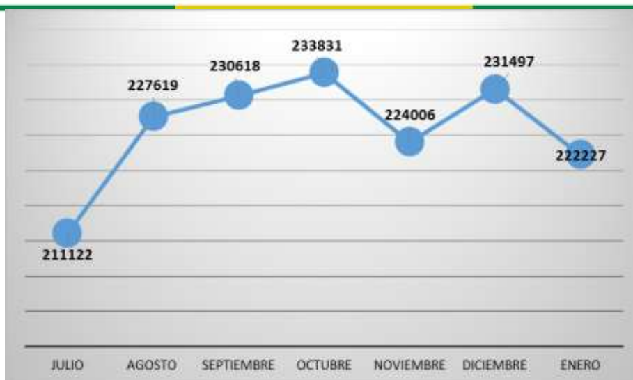
Gráfico 2. m³ facturados Julio – Diciembre 2023