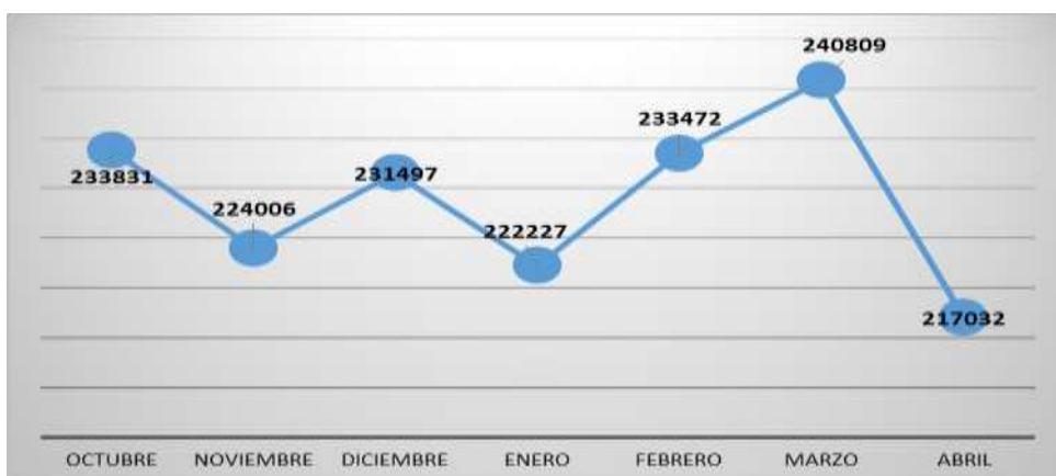
Gráfico 2. m³ facturados Octubre – Abril 2024