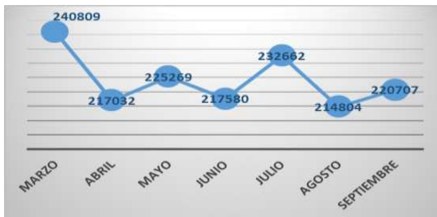
Gráfico 2. m³ facturados Marzo – septiembre 2024