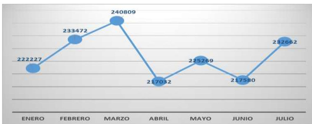
Gráfico 2. m³ facturados Enero – agosto 2024